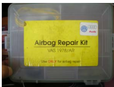
PHOTO 1 – TROUSSE DE RÉPARATION POUR LES VÉHICULES AUDI ET VOLKSWAGEN.